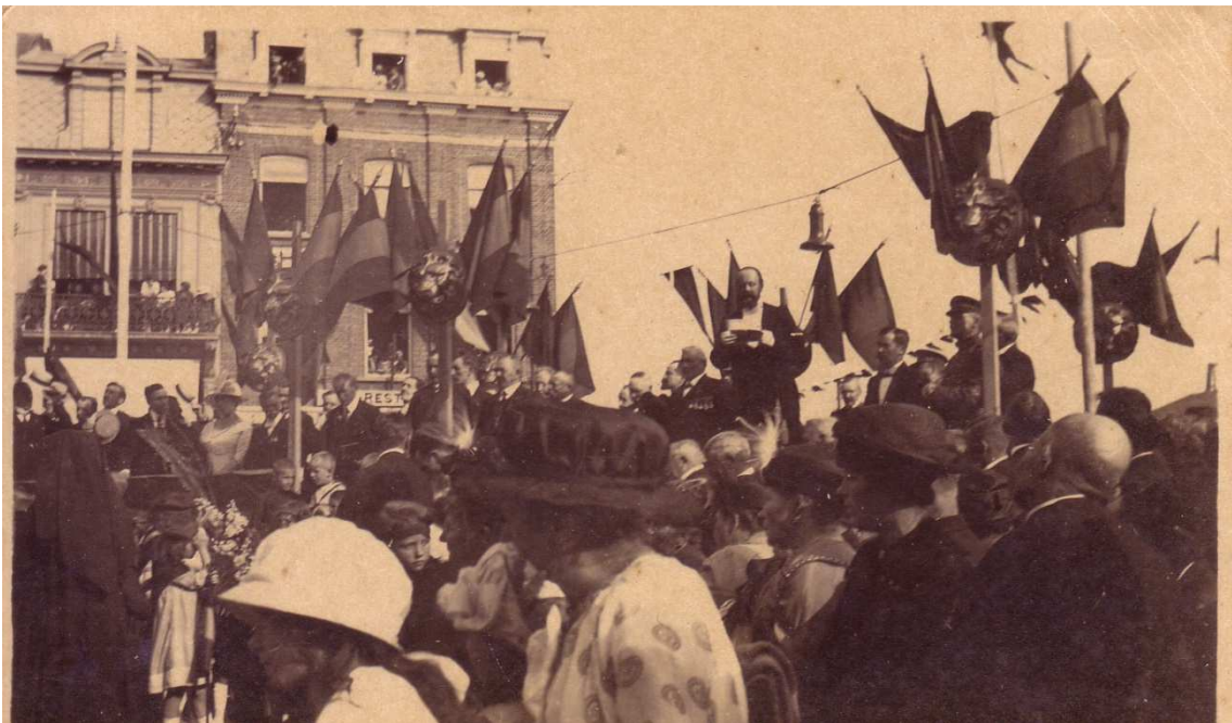
Locatie: Stationsplein, huidig Heldenplein Foto, zwart-wit; 13,3 x 8 cm;

© Collectie Museum Sinfala, Knokke-Heist, AVMFOFO52984