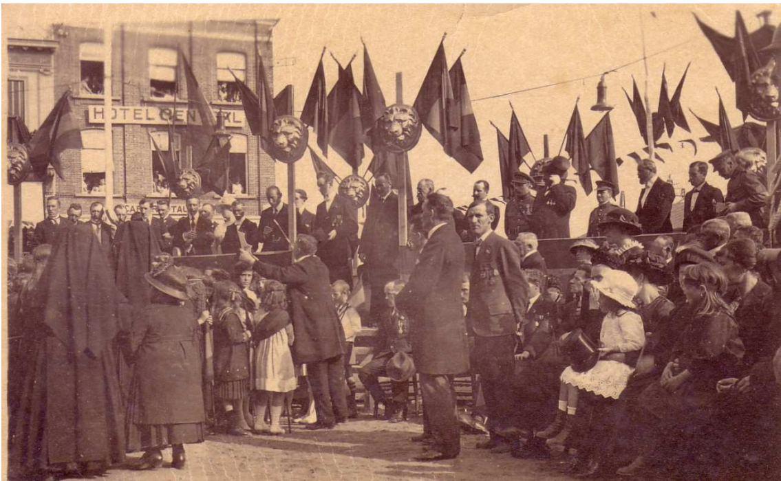
Locatie: Stationsplein, huidig Heldenplein; links op de achtergrond "Café Central" Foto, zwart-wit; 13,3 x 8 cm;

© Collectie Museum Sinfala, Knokke-Heist, AVMFOFO52982