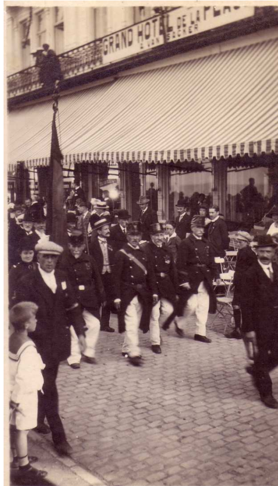
Locatie: Zeedijk Foto, zwart-wit; 8 x 13,3 cm © Collectie Museum Sinfala, Knokke-Heist, AVMFOFO52976