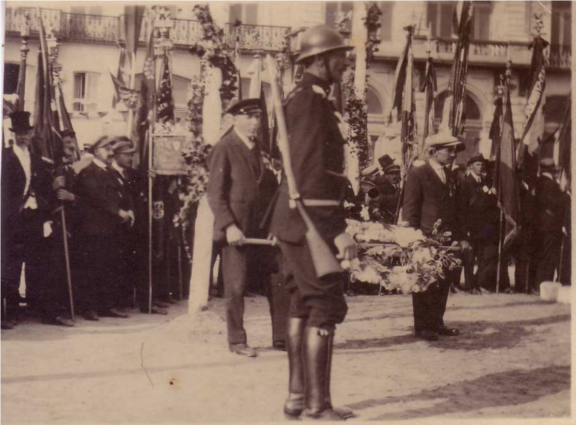
Locatie: Stationsplein, huidig Heldenplein Foto, zwart-wit; 13,3 x 8 cm;

© Collectie Museum Sinclala, Knokke-Heist, AVMFOFO52966