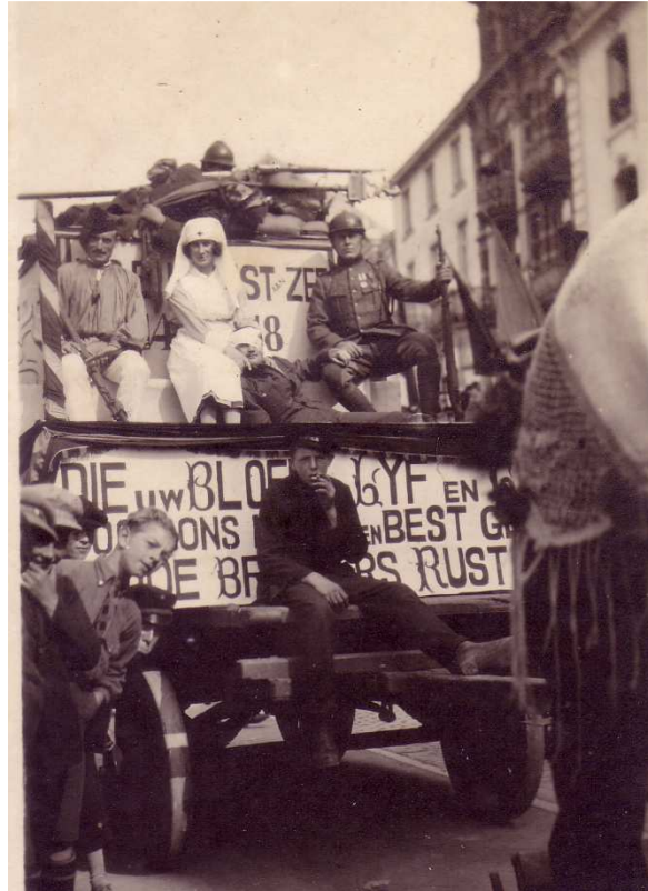
Locatie: Zeedijk Foto, zwart-wit; 8 x 13,3 cm;

© Collectie Museum Sinclala, Knokke-Heist, AVMFOFO52979