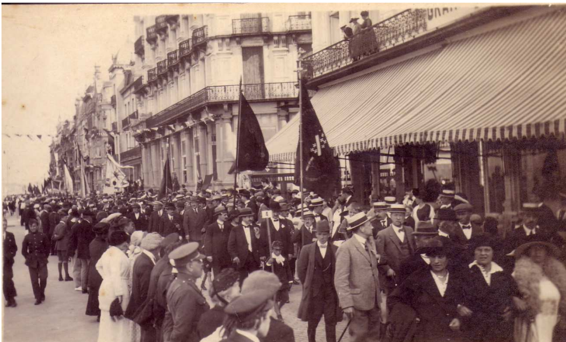
Locatie: Zeedijk Foto, zwart-wit; 13,3 x 8 cm;

© Collectie Museum Sinfala, Knokke-Heist, AVMFOFO52974