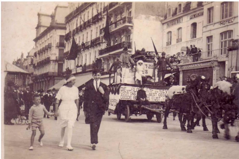
Locatie: Zeedijk Foto, zwart-wit; 13,3 x 8 cm;

AVMFOFO52979