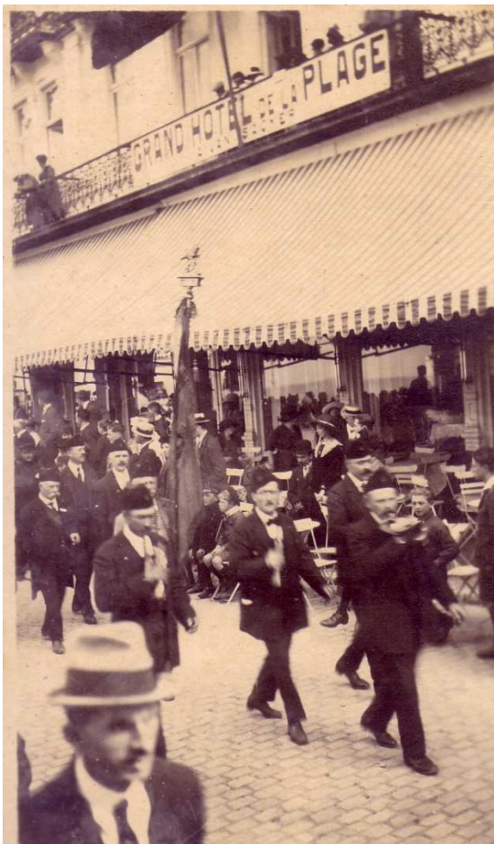
Locatie: Zeedijk, op de achtergrond het Grand Hotel Van Isacker dat naast het Kursaal stond dat nu verdwenen is Foto, zwart-wit; 8 x 13,3 cm

Inhuldiging van het "Gedenkteken ter nagedachtenis der 39 Heystsche Helden gesneuveld voor het vaderland" op zondag 4 september 1921. De foto's werden vervaardigd door Firmin Maelstaf (Heist). De foto's geven een beeld van hoe het er bij de inhuldiging aan toe ging.