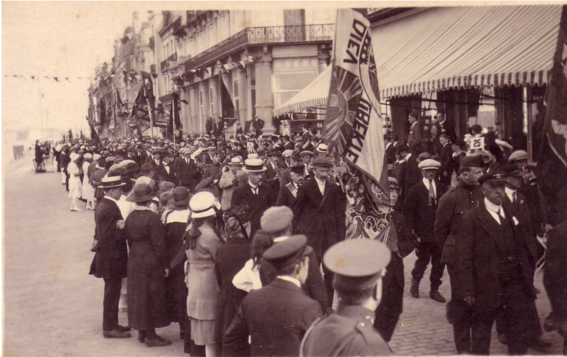
Locatie: Zeedijk Foto, zwart-wit; 13,3 x 8 cm;

© Collectie Museum Sinfala, Knokke-Heist, AVMFOFO52974