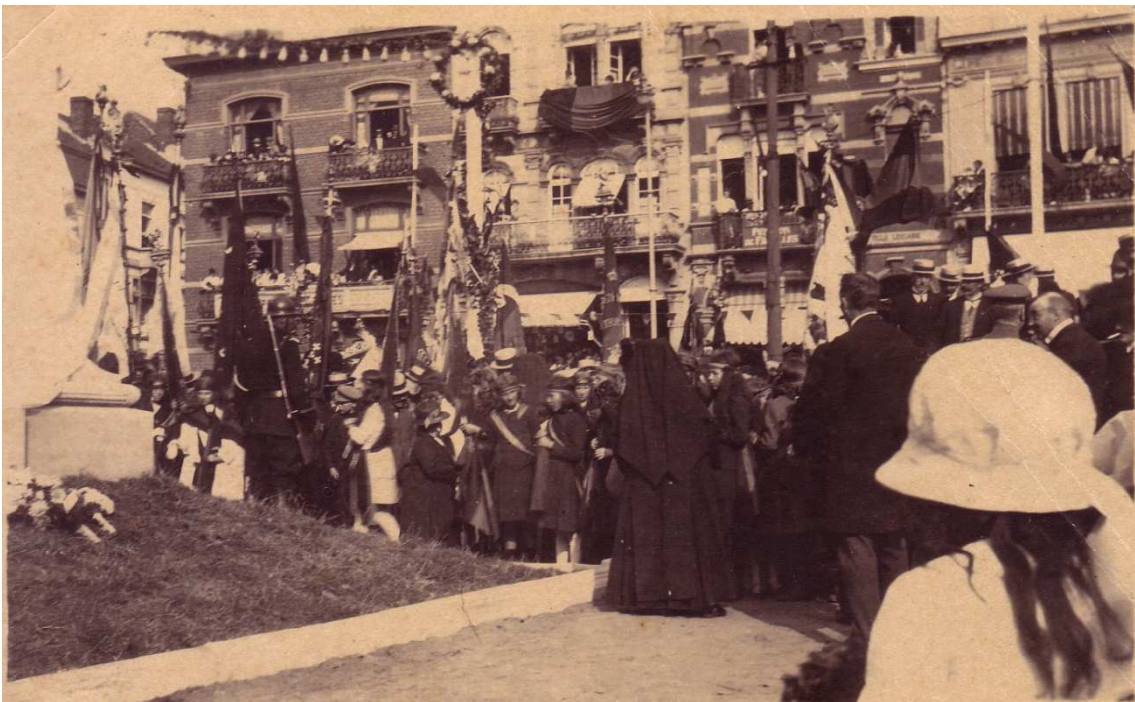
Locatie: Stationsplein, huidig Heldenplein Foto, zwart-wit; 13,3 x 8 cm;

© Collectie Museum Sinfala, Knokke-Heist, AVMFOFO52980