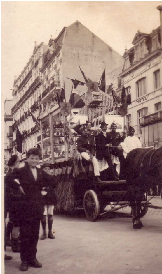
Locatie: Zeedijk Foto, zwart-wit; 8 x 13,3 cm

© Collectie Museum Sincfala, Knokke-Heist, AVMFOFO52977