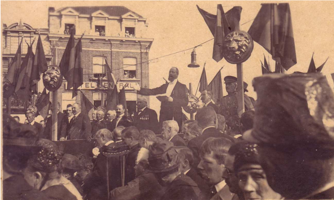
Locatie: Stationsplein, huidig Heldenplein Foto, zwart-wit; 13,3 x 8 cm

© Collectie Museum Sinfala, Knokke-Heist, AVMFOFO52984