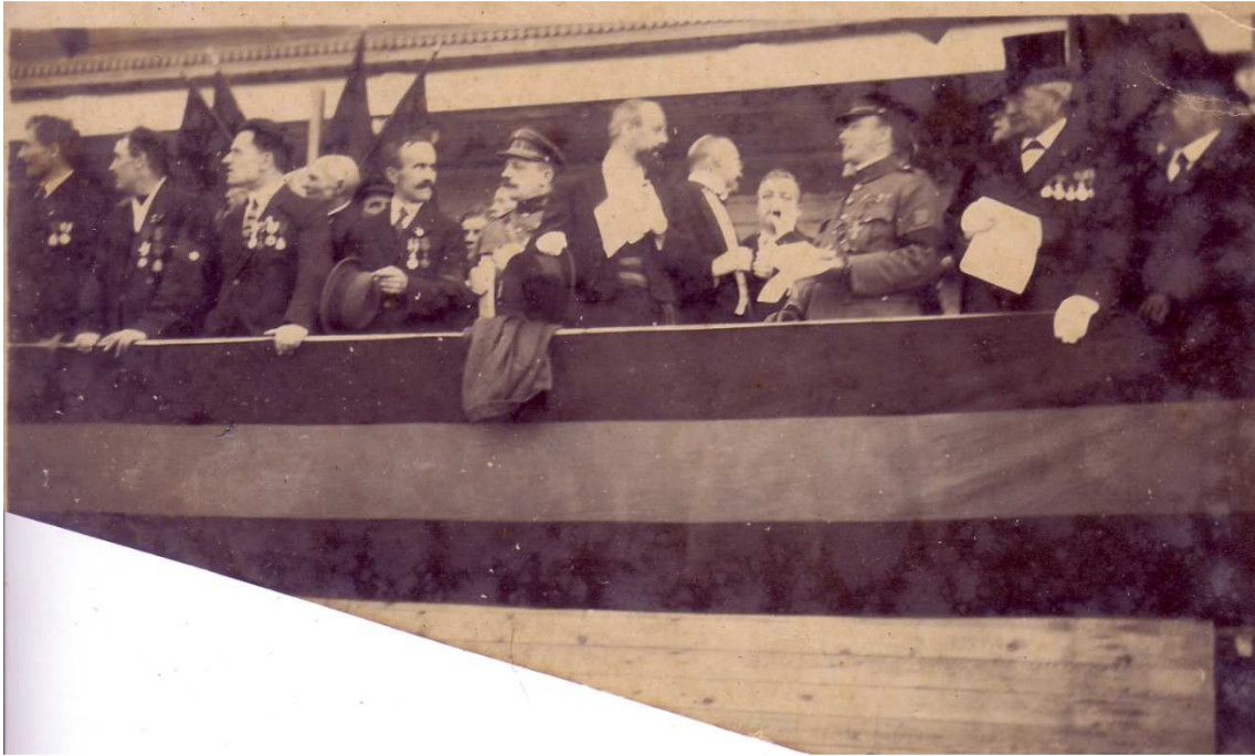
Locatie: Stationsplein, huidig Heldenplein Foto, zwart-wit; 13,3 x 8 cm;

© Collectie Museum Sincfala, Knokke-Heist, AVMFOFO52964