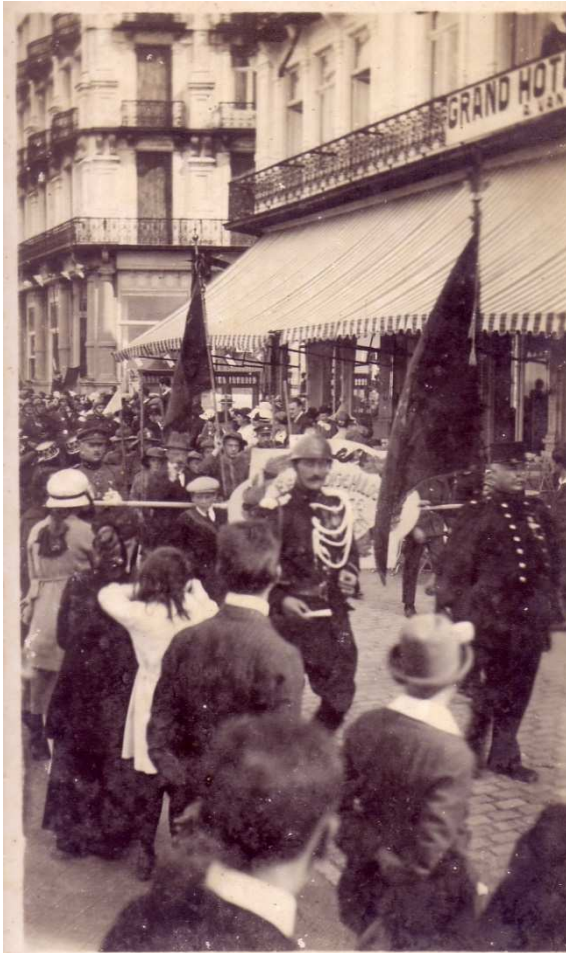
Locatie: Zeedijk Foto, zwart-wit; 8 x 13,3 cm © Collectie Museum Sinfala, Knokke-Heist, AVMFOFO52971