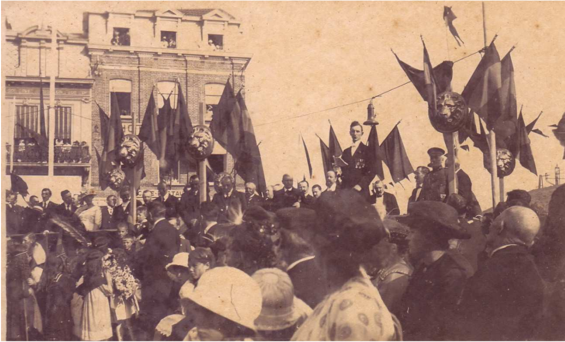
Locatie: Stationsplein, huidig Heldenplein Foto, zwart-wit; 13,3 x 8 cm;

AVMFOFO52982