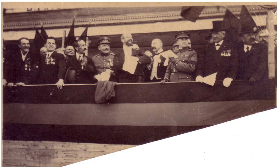
Locatie: Stationsplein, huidig Heldenplein Foto, zwart-wit; 13,3 x 8 cm;

© Collectie Museum Sincfala, Knokke-Heist, AVMFOFO52964