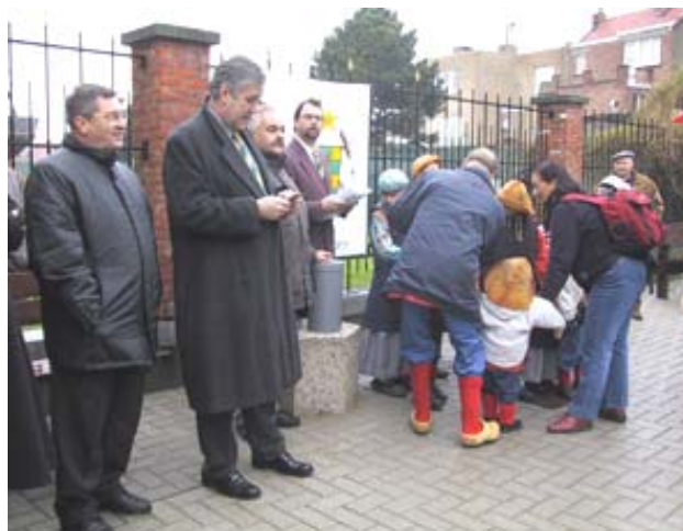
Plaatsen urne voor het Museum Sincfala

Heyst Leeft plaatste op 10 november 2002 om 11 uur een herinneringsurne in een columbarium op het trottoir voor het Museum Sincfala. In de urne werd documentatie gedeponereerd van en over Heist anno 2002. Bij notariële akte is voorzien dat op 10 november 2052 de urne terug opgegraven wordt, met de bedoeling de inhoud eventueel te kopiëren, terug in de urne te steken en aan te vullen met documentatie Heist anno 2052. Een dubbel van alle documenten wordt in het museum bewaard.