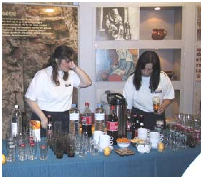
Het personeel aan het werk tijdens een receptie