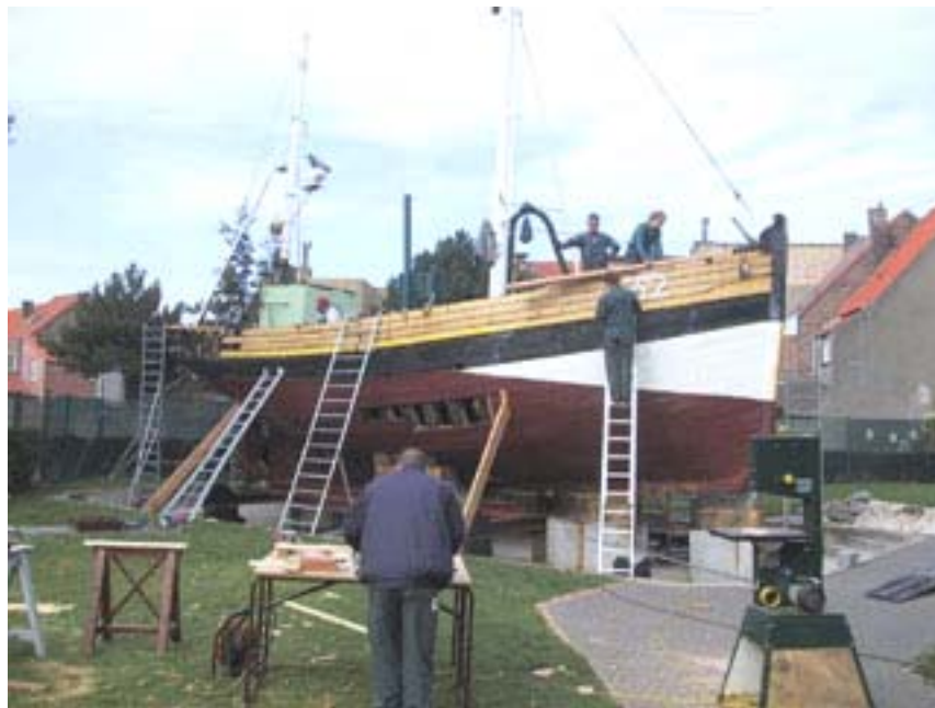
Archonaut aan het werk