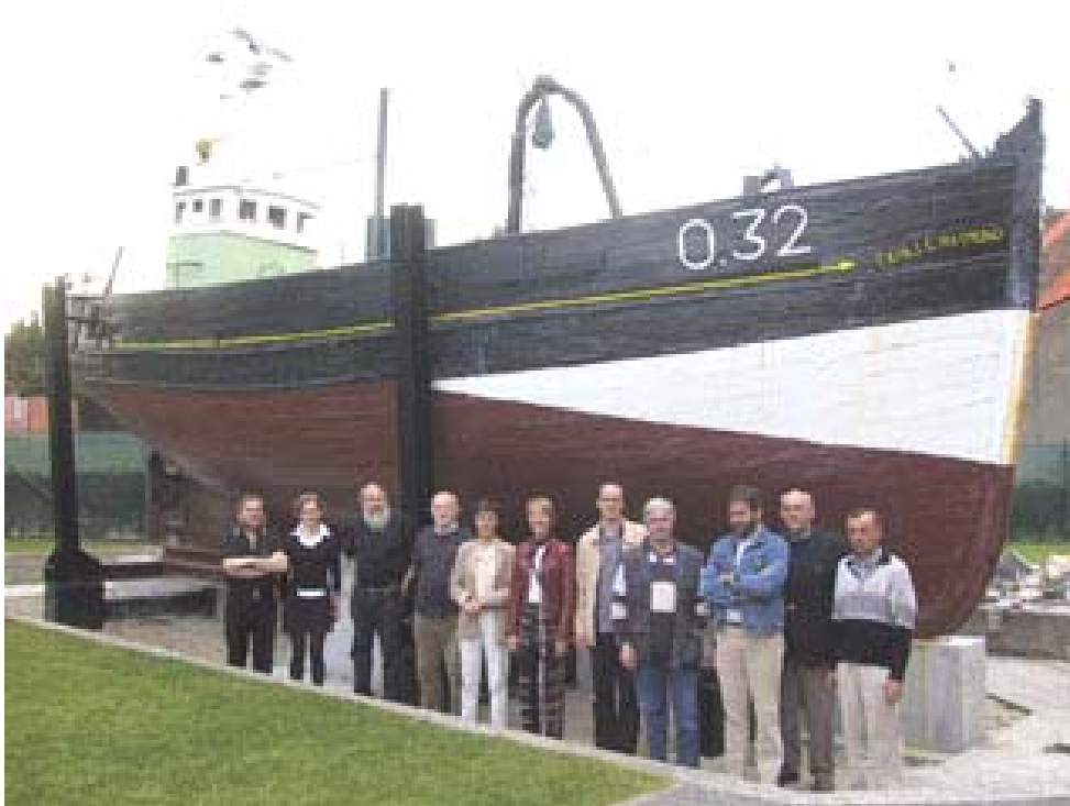
Bezoek Oostvlaamse museummedewerkers op maandagavond 27 mei

Na de opleiding eind 2002 bleek dat bepaalde zaken in de ingevoerde records moeten hernomen worden. Om een degelijke ontsluiting te kunnen verzekeren moesten alle trefwoordenlijsten eerst worden opgekuist wat een omslachtige procedure is. Eind 2002 was dit prioriteit voor het personeel.