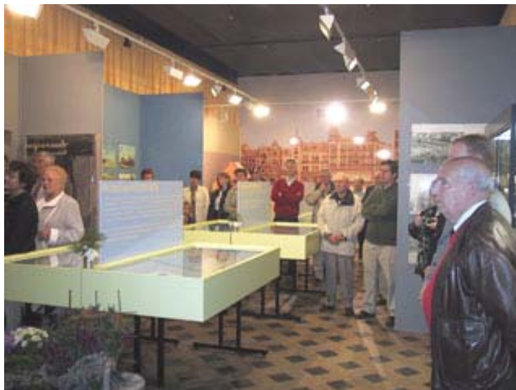
Opening 'Klinkende munt, Klatergoud'