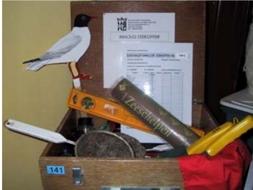
De koffer uitleendienst

In de maand november werd een kleine stand uitgebouwd in de gang van het museum waar de uit te lenen koffers zijn uitgestald. Leerkrachten op prospectie kunnen er kennis maken met de didaktische koffers en de materialen waarmee ze met hun leerlingen op stap kunnen.