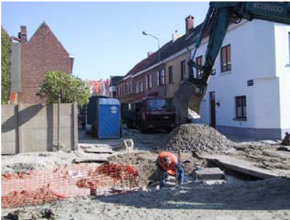
De wegeniswerken die in het voorjaar de toegang tot het museum moeilijk maakten

De huidige introductiezaal wordt ruimte voor tijdelijke tentoonstellingen. De educatieve dienst kan op de zolder van het huidige museum, maar wordt ruimer opgevat.